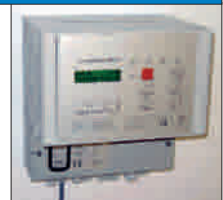
Kundenspezifische Tastatur: Interface zu einer Brandschutzsteuerung von gte Brandschutz