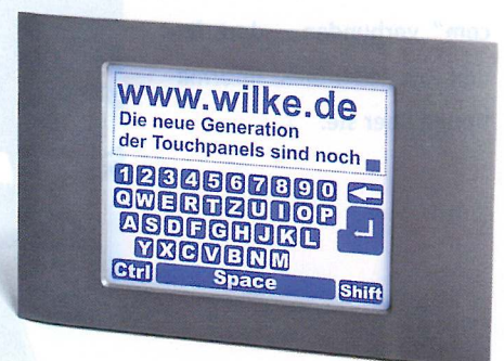
Abb. 3: Der Wilke TP 1000, der in Zusammenarbeit mit Bopla entstanden ist. Auf das gebogene Gehäuse sind die Ostwestfalen besonders stolz.

lichkeit entwickelt. Sind die Tasten bei einer Standard-Tastatur in der Regel nur 0,3 mm hoch, werden bei Profiline die integrierten Acryl-Inlays zwischen Frontfolie und Schnappscheibe platziert, wodurch nach anschließender Prägung der Frontfolie die Tasten bis zu 2 mm hoch ausgeführt werden können. Der Benutzer bekommt dadurch die Möglichkeit, die Tasten auch bei Verwendung von Handschuhen zu erfüllen. So kann man sie auch während der Arbeit in rauer