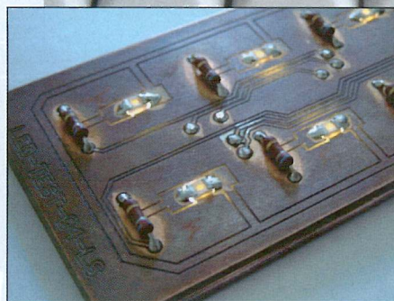
Abb. 2: Die Technik hinter den Schnappscheiben: die Beleuchtung jeder Taste lässt sich einzeln steuern.

Deswegen setzen die IPC-Hersteller Tastaturen ein, die einiges aushalten – wie bspw. die Tasta-