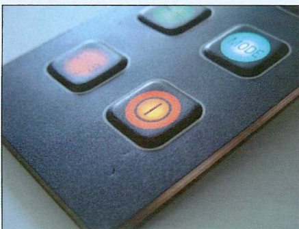
Abb. 1: Durch die zentral sitzende Leuchtdiode und ein intelligentes Konzept leuchten die Tasten gleichmäßig.

Robuste Tastaturen müssen heute einiges aushalten und trotzdem benutzerfreundlich sein: Neben der Bedienung mit dem Handschuh dürfen sie auch nicht die Arbeit einstellen, wenn die Tasten mit einem Werkzeug bedient werden. Wir stellen eine Tastatur vor, der das nichts ausmacht – sondern selbst mit Schraubenzieher noch funktionsfähig bleibt.