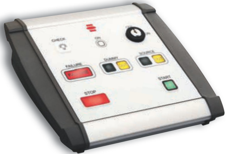
Bild 2: Die von Bopla komplett gelieferte Steuereinheit für das Krebsbestrahlungsgerät Multisource HDR (rechts).

Alu-Topline verfügt über eine Folienfläche, die Eckert & Ziegler Bebig zum Aufbringen der Folientastatur verwendet hat, die in der Abteilung Eingabeeinheiten bei Bopla in Bünde eigens für des Multi-source HDR konstruiert und von den Service-Spezialisten im Hause aufgebracht wurde. Die Tastatur basiert auf der Profiline-Technologie, zusätzlich sind die einzelnen Tasten der Tastatur hinterleuchtet – das Bedienen des Gerätes ist demnach auch bei unklaren Sichtverhältnissen (zum Beispiel in abgedunkelten Räumen) möglich. Das Besonde-